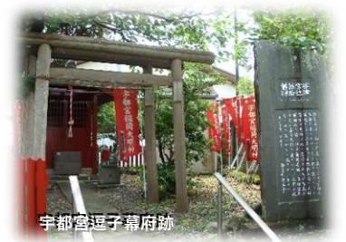
宇都宮逗子幕府跡

※当日は行程地図を配布いたします。行程内容は諸事情により変更することもございますので、あらかじめご了承ください。 ※昼食は各自お取りいただきます。