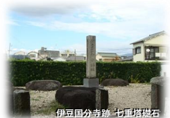
伊豆国分寺跡 七重塔礎石

※当日は行程地図を配布いたします。行程内容は諸事情により変更することもございますので、あらかじめご了承ください。 ※昼食は各自お取りいただきます。