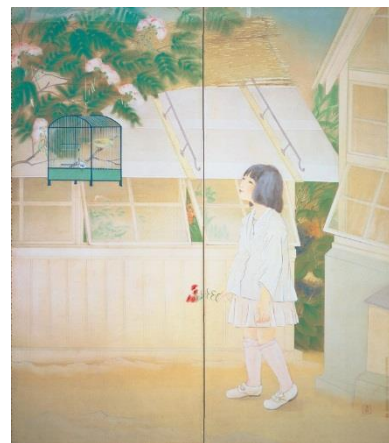
山口蓬春《初夏の頃(佐保村の夏)》 大正13年 山口蓬春記念館蔵

所在地 〒240-0111 神奈川県三浦郡葉山町一色2320 TEL: 046-875-6094 FAX: 046-875-6192 URL: http://www.hoshun.jp/