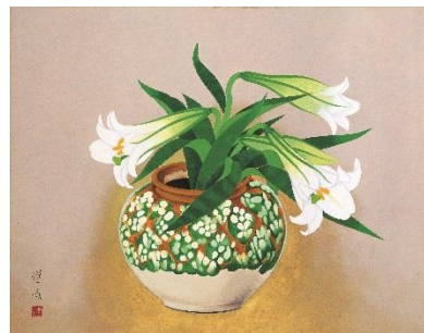
山口蓬春《百合》昭和32年 山口蓬春記念館蔵