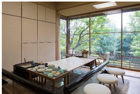
画室(吉田五十八氏設計)昭和28年

山を背にして葉山の海をのぞむ風光明媚な場所に立地する当館では、蓬春の作品やコレクションを展示するほか、著名な建築家である吉田五十八氏設計のアトリエ、四季の趣豊かな庭園を公開しております。来館された方には、蓬春の生前の創作活動に想いを馳せていただくとともに、葉山の自然を満喫していただけます。