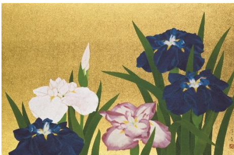
山口蓬春《花菖蒲》昭和37年 山口蓬春記念館蔵