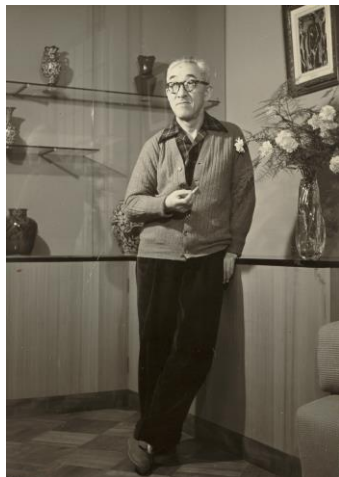
画室にたたく蓬春

山口蓬春(1893-1971)は、東京美術学校(現・東京藝術大学)日本画科に学びました。古典による伝統的な日本画を探究する一方で、西洋画の技法を取り入れる等、従来にない数々の試みを実践し、独自の新日本画の世界を築きました。日本画の進展に大いに貢献した蓬春は、昭和40年には文化勲章を受章、数々の業績を残しています。