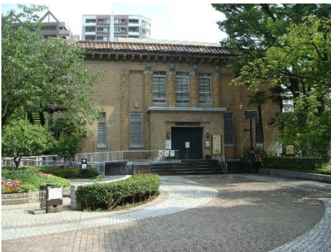
東京都復興記念館

【主な史跡】 舟橋聖一生誕の地、与兵衛鮫発祥の地、本因坊屋敷跡、勝海舟生誕の地、芥川龍之介生育の地、江川太郎左衛門屋敷跡、津軽家上屋敷跡ほか