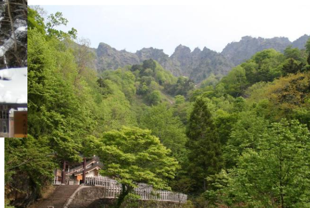
奥社より戸隠山望む