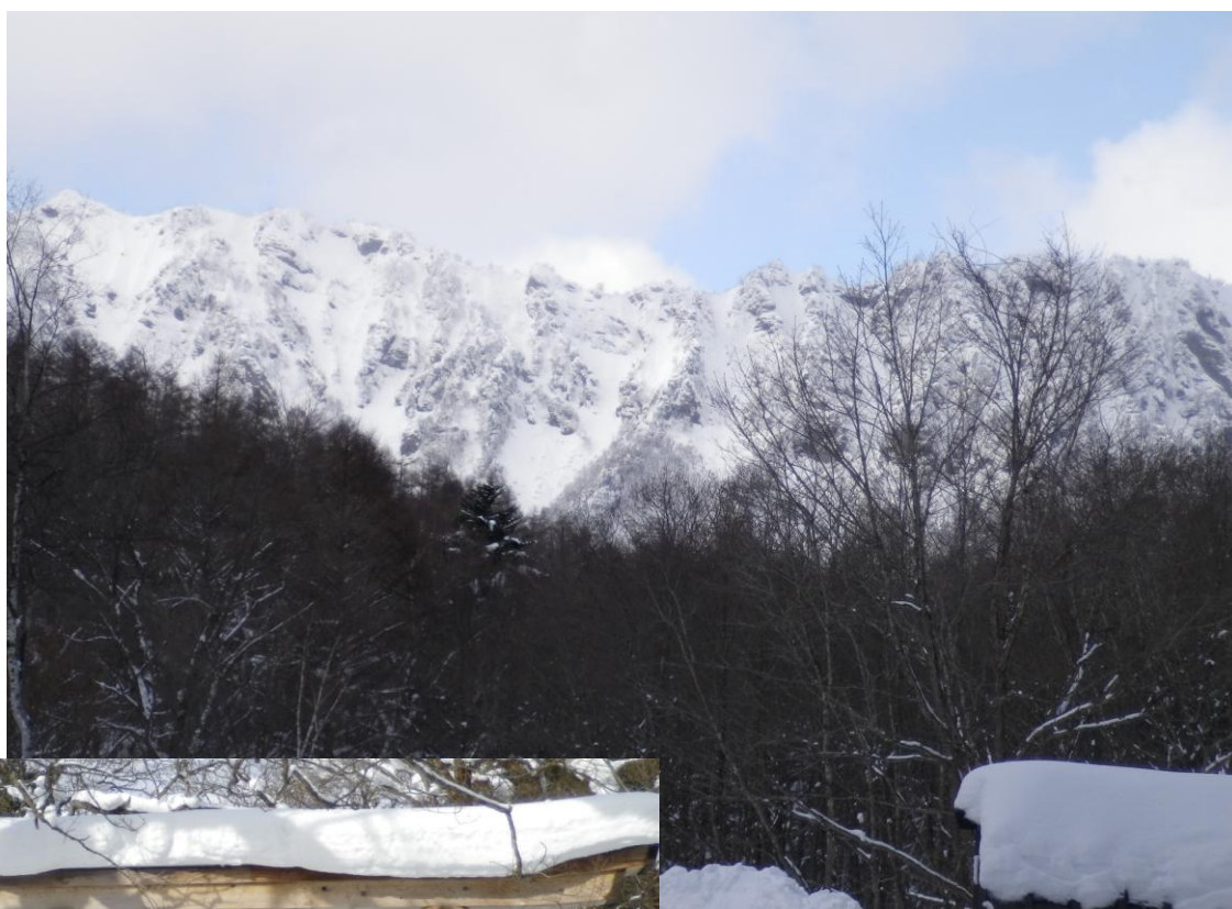
戸隠山…スキー場より 1月下見時