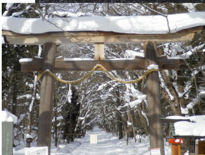
戸隠奥社参道口より 1月下見時