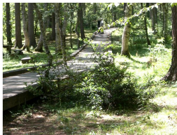
森林植物園内木道